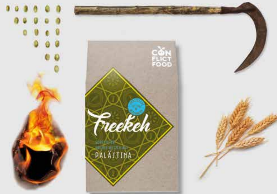
BIO FREEKEH FRIEDENSPÄCKCHEN